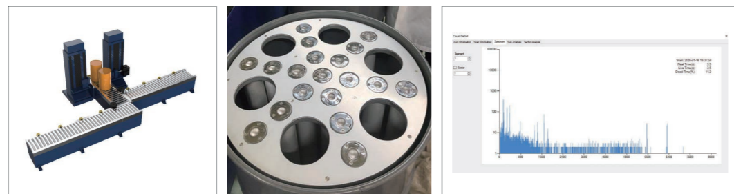
< 드럼스캐너 개략도 >