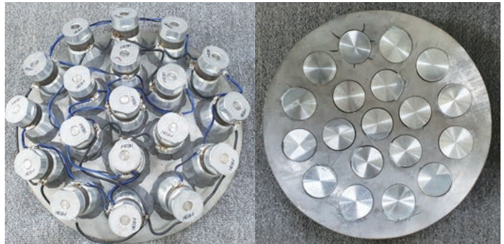
< 집속초음파 구현을 위한 반구형 진동자 설계 >