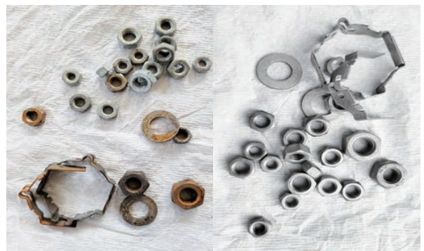
< 제염 전 >